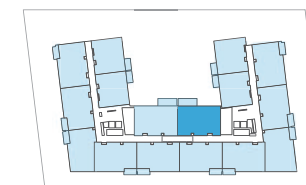
PLANTA TIPO 1ª 2ª Y 3ª