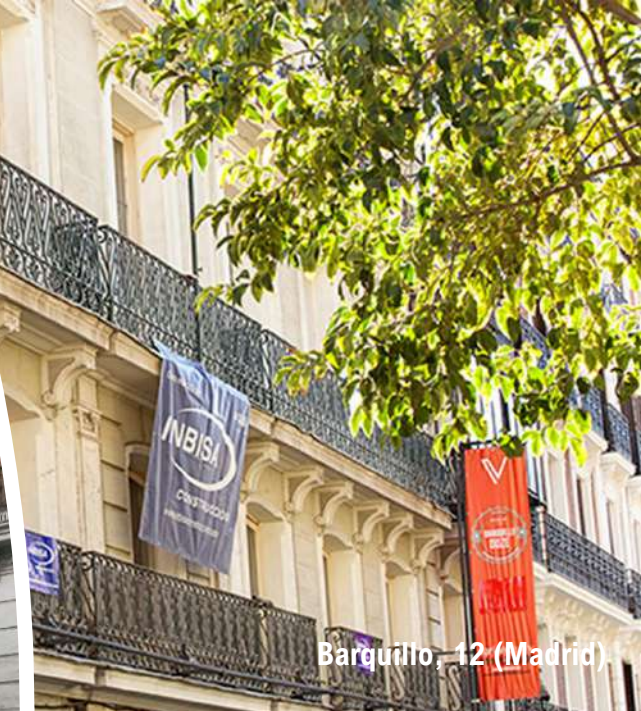
Barquillo, 12 (Madrid)