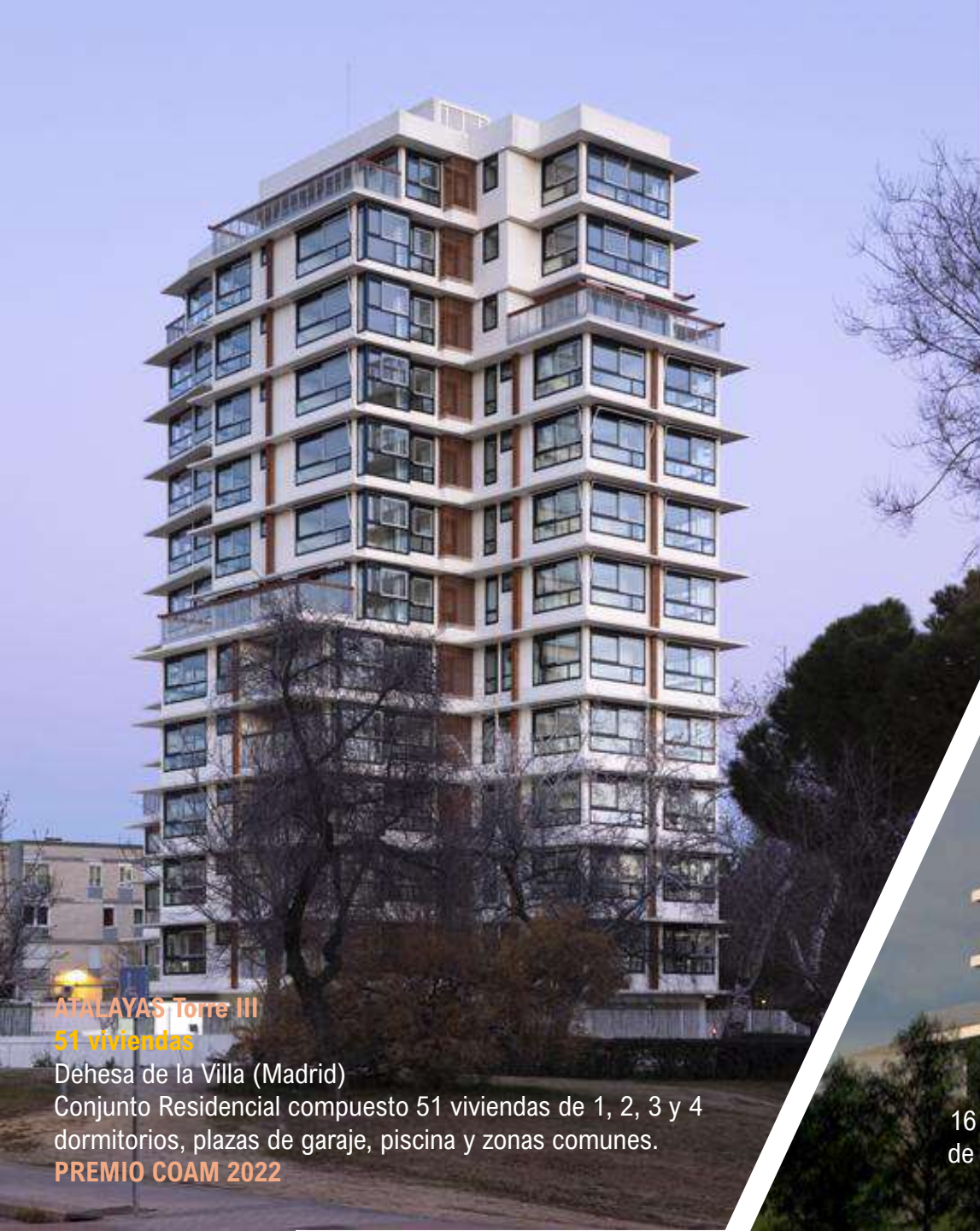
ATALAYAS Torre III 51 viviendas

Dehesa de la Villa (Madrid) Conjunto Residencial compuesto 51 viviendas de 1, 2, 3 y 4 dormitorios, plazas de garaje, piscina y zonas comunes.