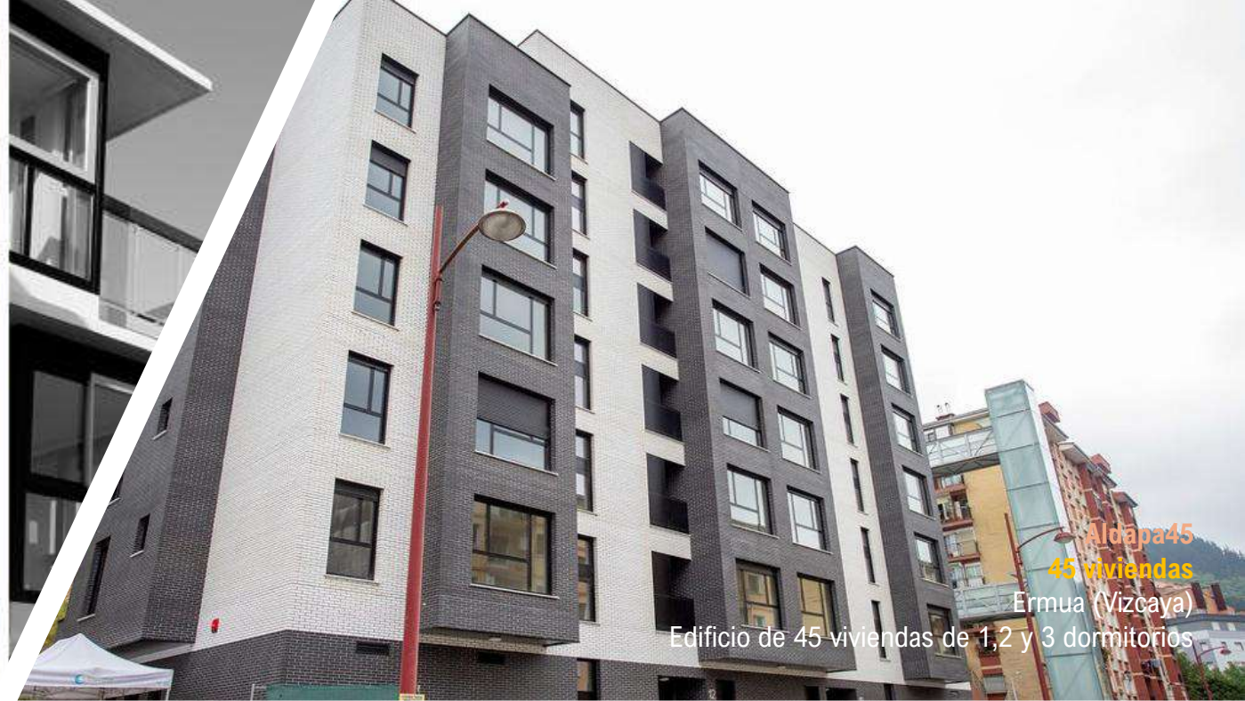
Aldapa45 45 viviendas