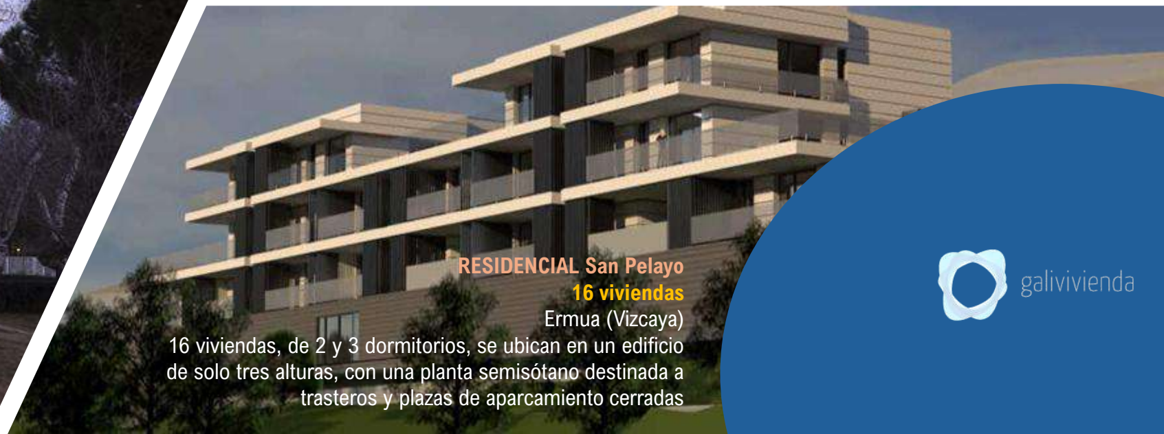
RESIDENCIAL San Pelayo 16 viviendas

Edificio de 45 viviendas de 1,2 y 3 dormitorios