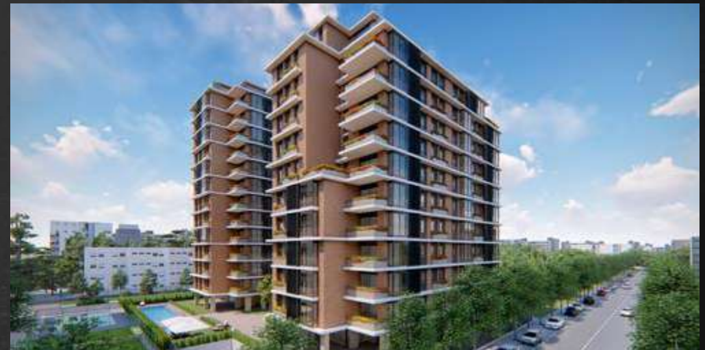
TORRES ATALAYA DE LA DEHESA · DEHESA DE LA VILLA