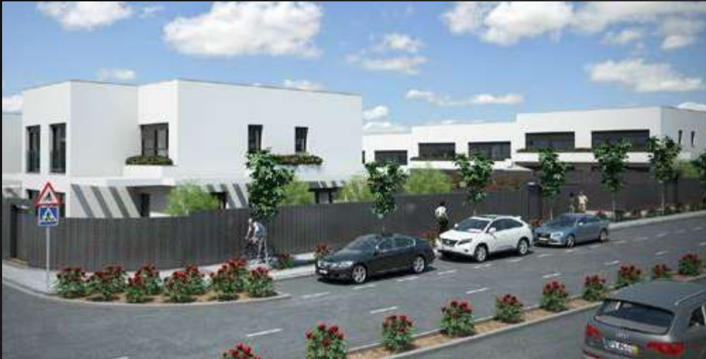
RESIDENCIAL LOS BALCANES · TRES CANTOS