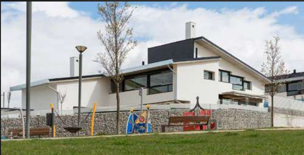
CASAS JARDÍN · BOADILLA DEL MONTE