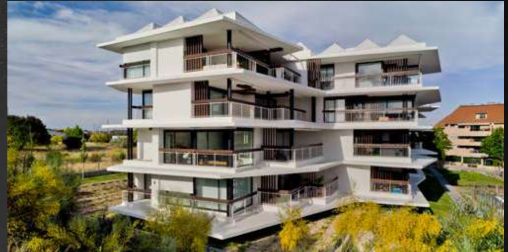
EDIFICIO ACANTILADO · BOADILLA DEL MONTE